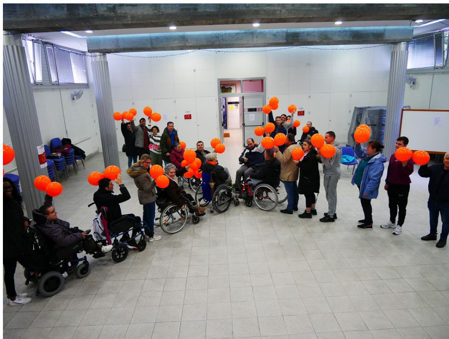
22/10/2024: Campaña de denuncia da dificultade accesibilidade no transporte