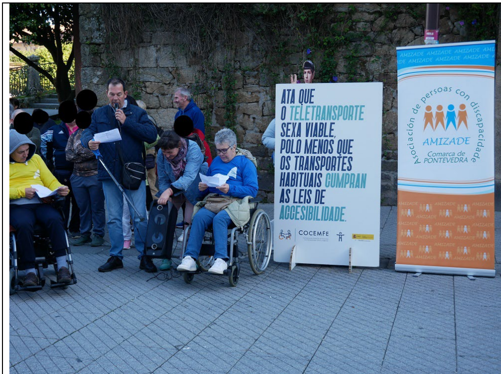
03/12/2024: Campaña Baixo o Mesmo Paraugas