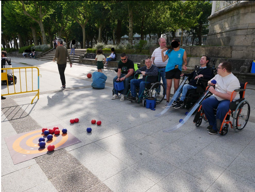
04/11/2024: Charla de sensibilización na Universidade de Vigo (campus Pontevedra)