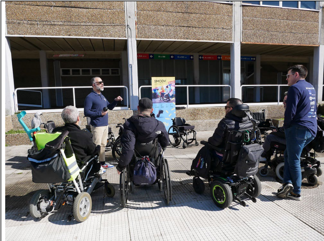
03/04/2024: Acto difusión X Solidaria