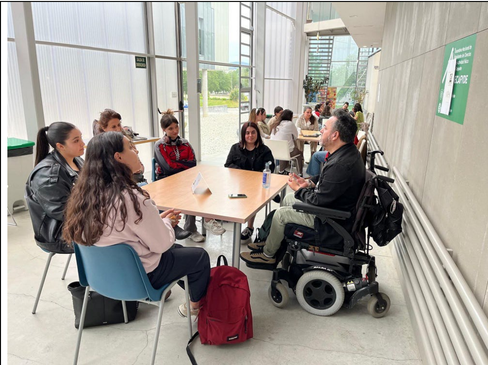
10/05/2024: Organización da V Xornada Multideportiva Adaptada en colaboración coa Fundación También, o Concello e a Deputación de Pontevedra.